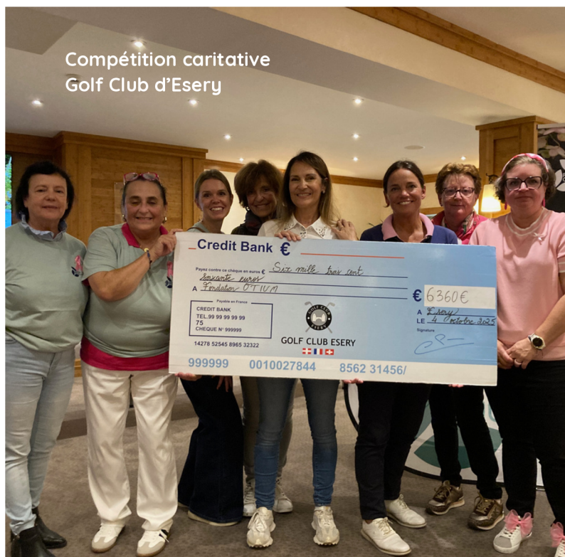
Compétition caritative Golf Club d'Esery