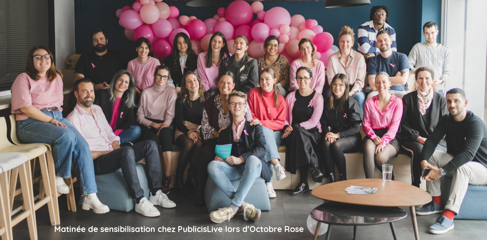
Matinée de sensibilisation chez PublicisLive lors d'Octobre Rose