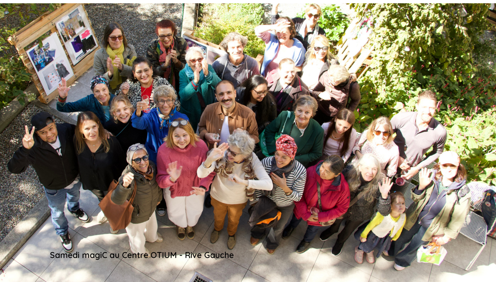
Samedi magiC au Centre OTIUM - Rive Gauche