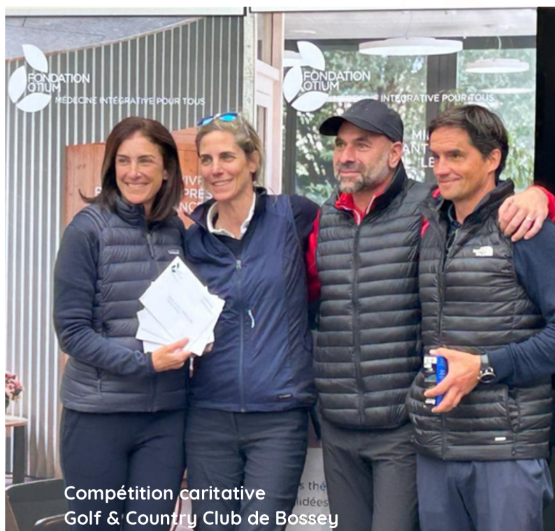
Compétition caritative Golf & Country Club de Bossey