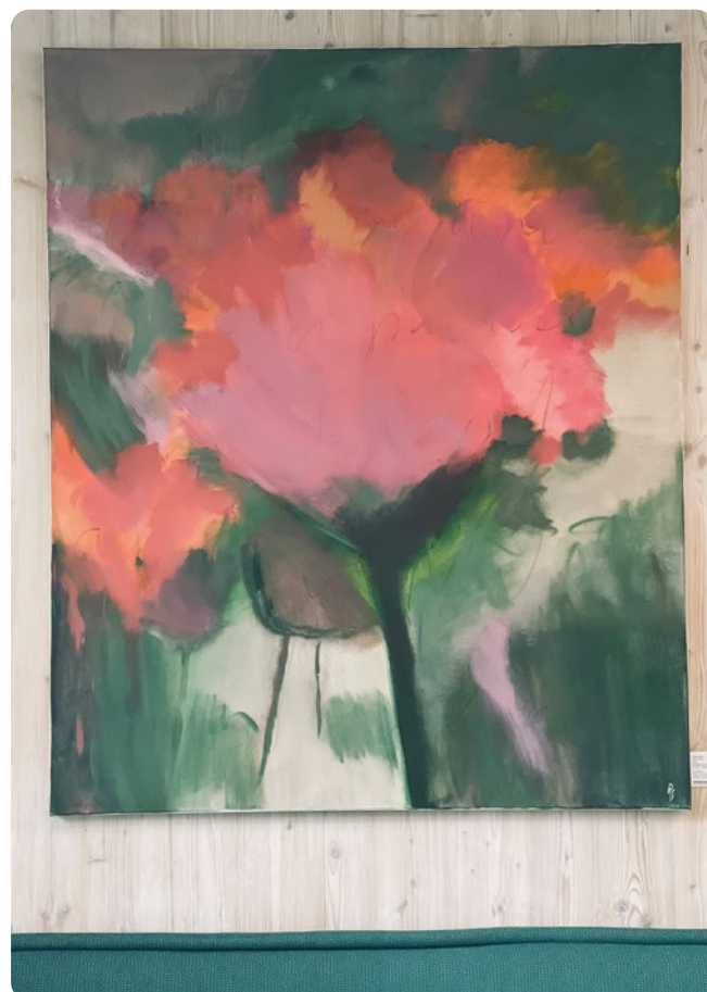
EXPOSITION Le féminin sacré

Tout au long de l'année, les Centres OTIUM multiplient les initiatives pour créer des passerelles, du lien, de l'échange.