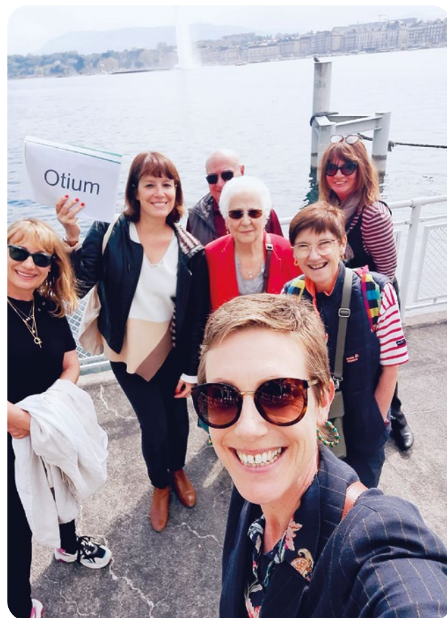
CULTURE Visites de Genève

Tout au long de l'année, les Centres OTIUM multiplient les initiatives pour créer des passerelles, du lien, de l'échange.