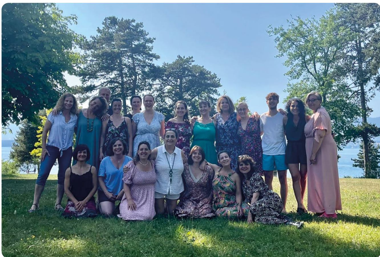
SÉMINAIRE OTIUM - 17 JUIN 2022